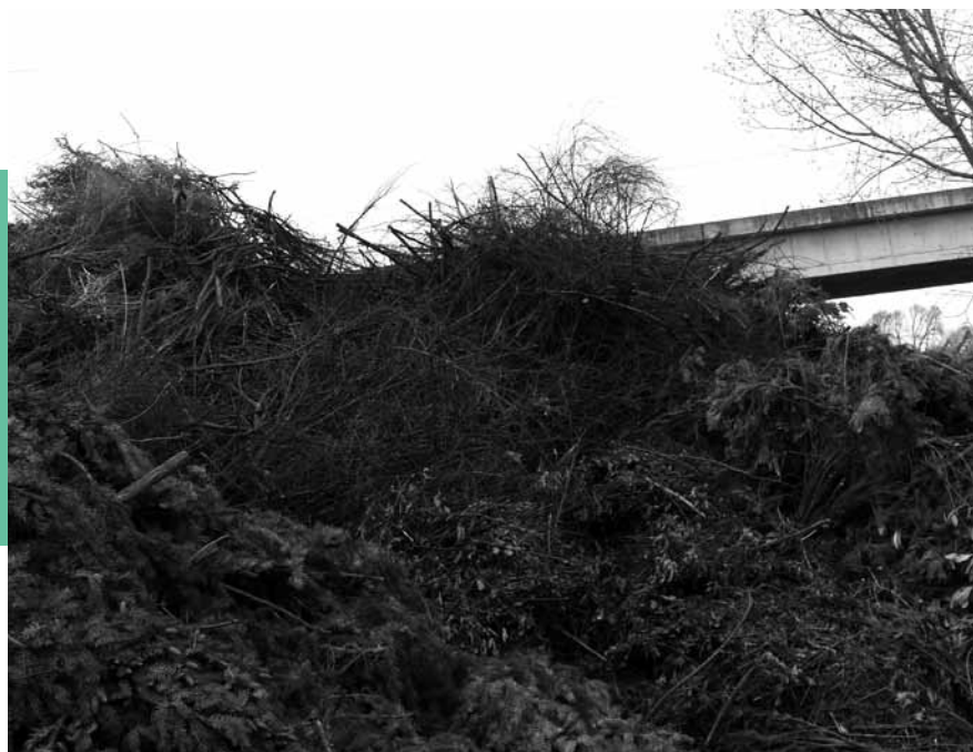
Les différentes phases de production du combustible: séchage, broyage, criblage.